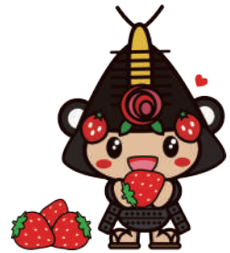
21いちごを食べているわたりん1