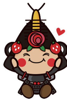
11わたりん「美味しそうな顔」1