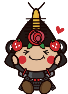
12わたりん「美味しそうな顔」2