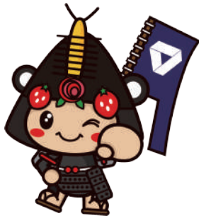
07わたりん新おまけ