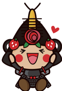
13わたりん「美味しそうな顔」3