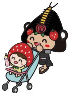
28ゆりんベビーカー