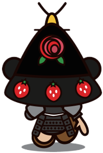
04わたりん背中向き