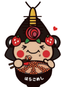
24はらこめしを食べているわたりん2