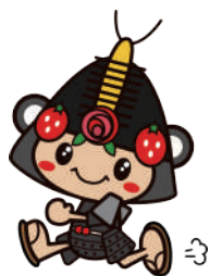
35 わたりんランニング