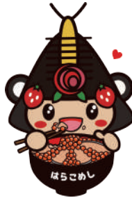
23はらこめしを食べているわたりん1