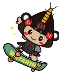
33 スケボーわたりん