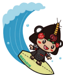
32 サーフィンわたりん