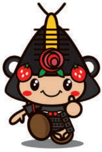
01わたりん名前なし用