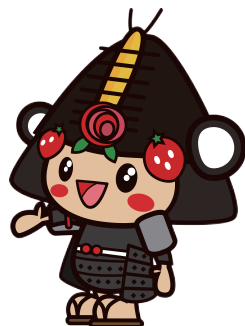
14紹介しているポーズ