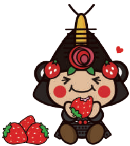
22いちごを食べているわたりん2