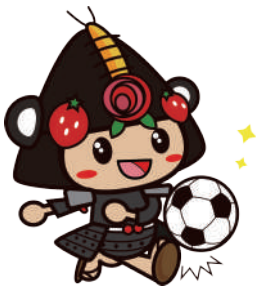
25わたりんサッカー