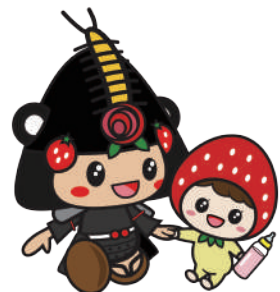
30ゆりん手をつなぐ